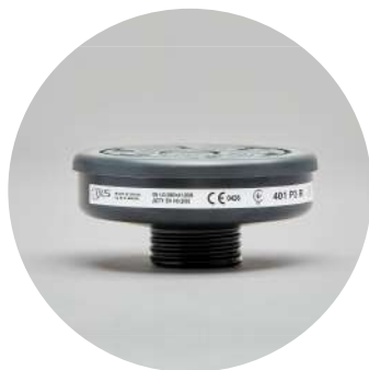
Filtros serie BLS 400