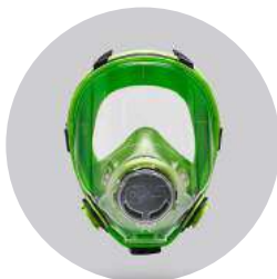
Máscaras BLS 5700