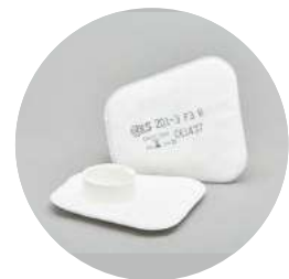
Filtros planos serie BLS 201