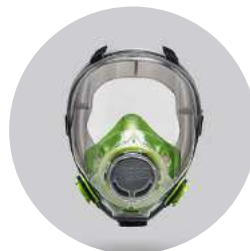
Máscaras BLS 5600